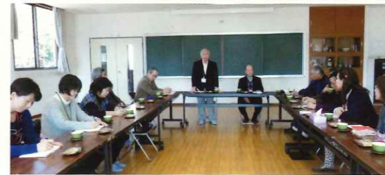
仲町・助川交流センター合同研修会

皆さんに親しまれ、安心してご利用いただける交流センターを目指して、地域との交流を進めるべく、二月二十七日に仲町交流センターとの合同研修会を、両センター長・協力員合計二十一人で行いました。お互いに喜ばれるセンターづくりに向け有意義な意見交換の場となりました。