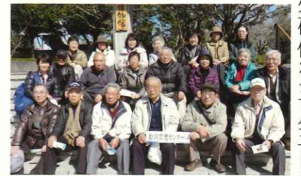
26年度 助川歴史講座 後期野外研修 3月5日