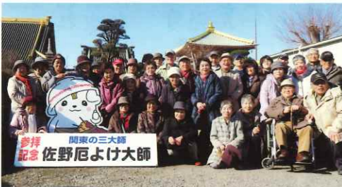
全員満面の笑みで 厄除祈願の養正塾生達