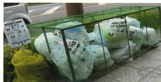
鳥の被害対策にも、還元金の活用を。

行程:助川小学校(出発9:00)→ 城址公園→山の神→助川山→おむすび 池(昼食)→山根方面