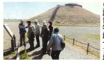
圧倒されたさきたま古墳公園

行田市・野田市を巡る野外研修を三月五日(木)行な いきました。さきたま 史跡博物館や古墳公