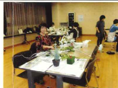
かわいい!手づくり雑貨教室も

いつも助川交流センターをご利用頂きありがとうございます。感謝申し上げます。平成27年度生涯学習部として、皆様の健康促進に努めて参りますので、宜しくお願いたします。