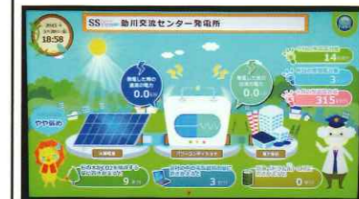
助川交流センターに設置された監視盤

日立市の「未来都市モデルプロジェクト」太陽光発電システムが三月十四日より運用しました。日立市の「未来都市モデルプロジェクト」太陽光発電システムが三月十四日より運用しました。