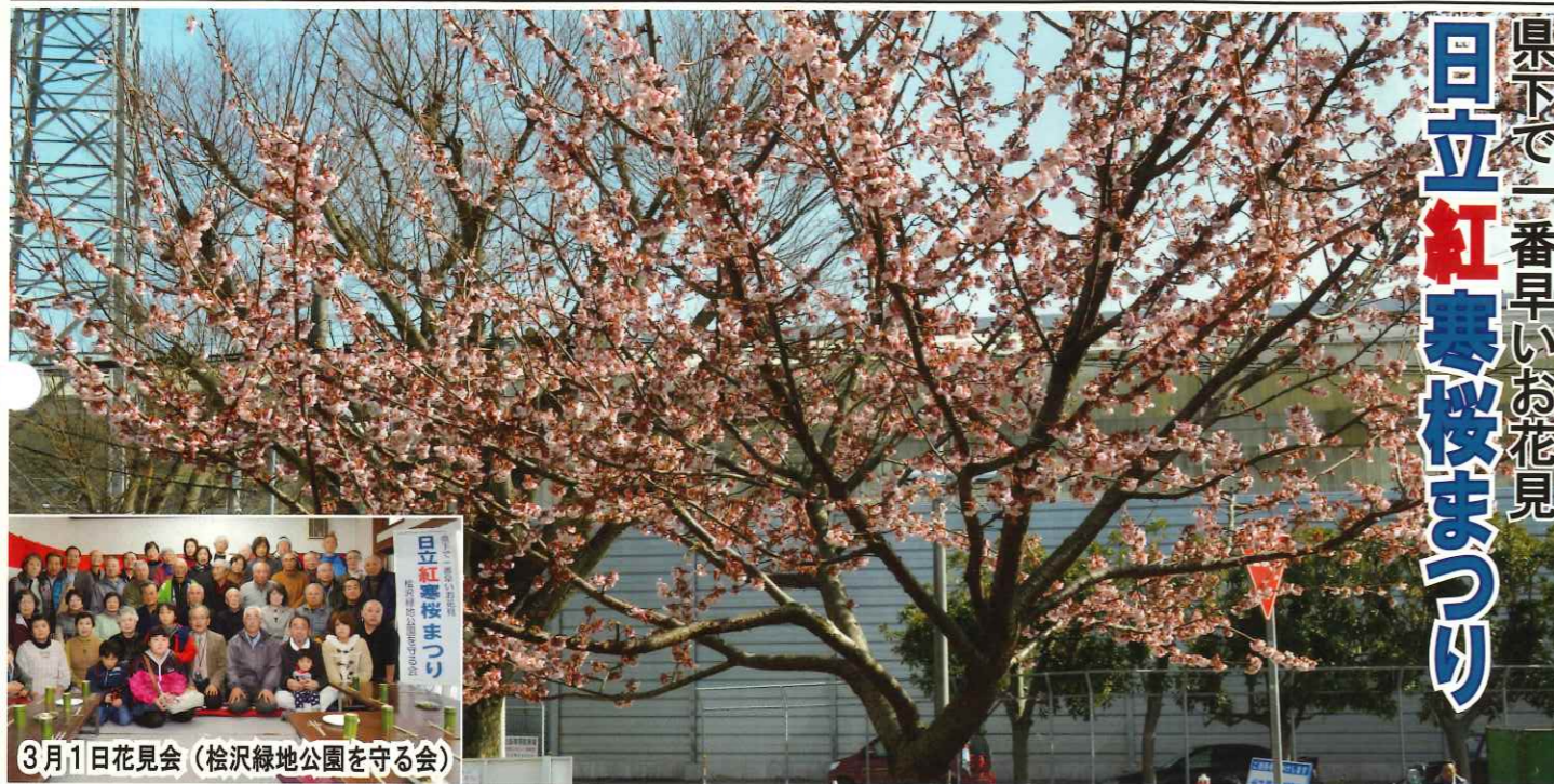
県下で一番早いお花見 日立紅寒桜まつり

発行 助川学区コミュニティ推進会 編集 調査広報部 事務局 〒317-0071 日立市鹿島町1-21-7 助川交流センター内 TEL 0294-23-0955