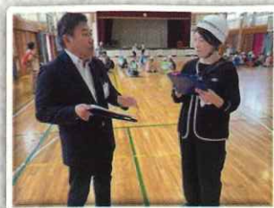
助川小学校体育館にて

小学校にとって地域との連携の一番の目的は防災ではないかと思えます。日頃から防災意識を高め、災害への具体的な備え訓練が大事です。今後も地域全体が協力して安全を守ってまいります。