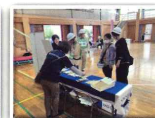
東京ガス(株)日立支店 共創推進部