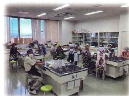
今回が2回目の料理教室になります(参加者15名)