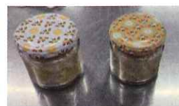
サツマイモのジャムはお持ち帰り