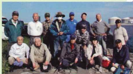
悪条件の中 ご苦勞様でした 久慈川河口にて